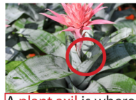
A plant axil is where the leaf meets the stem.