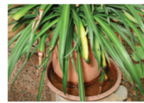
Saucers under plants

Los Aedes invasivos tienen un rango de vuelo corto de ¼ milla y, como resultado, generalmente se encuentran en las cercanías generales donde se desarrollaron. En California, la mayoría de las poblaciones de Aedes se han recolectado en los patios traseros de los barrios residenciales, lo que significa que los propietarios pueden marcar una gran diferencia en el manejo de la población mediante la eliminación de toda el agua estancada en su propiedad de la población mediante la eliminación de toda el agua estancada en la propiedad. Cualquier elemento que contenga tan poca como una cucharadita de agua por más de unos pocos días, como tapas de botellas, tazas, basura, etc., tiene la capacidad de producir mosquitos Aedes . Por lo tanto, necesitamos su ayuda para mantener el vecindario libre de Aedes invasivo.