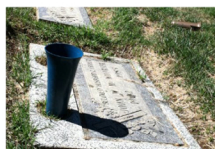
Cemetery flower vases